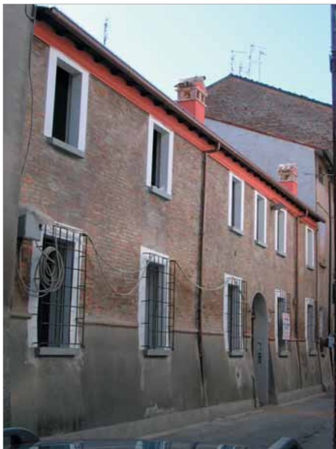
Via Ercolani 12 Fronte Principale